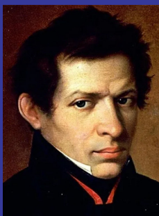
Лобачевский Н.И. 1792-1856