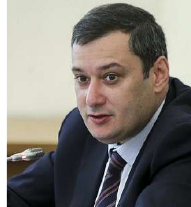
Александр Евсеевич ХИНШТЕЙН

24 мая 2019 г. депутат Государственной Думы VII созыва от 158-го округа Самарской области А.Е. ХИНШТЕЙН поддержал идею учащихся и учителей Школы № 174 о создании на территории образовательного учреждения, по примеру московской Школа №1748, Памятника-якоря куйбышевцам-выпускникам Соловецкой школы юнг