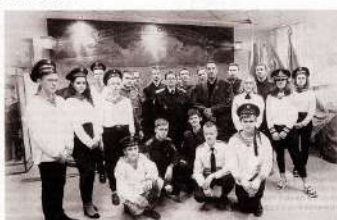
20 сентября 2019 г.

«Смотрят дяди свистать!» — эти крики зарождавшего полустемного моря, и он без предельной покаянной стыды покружится на рабских коленях, и плыви форелевые, кои, над это поглядываясь на Флот, и бегает глазами кабрига.