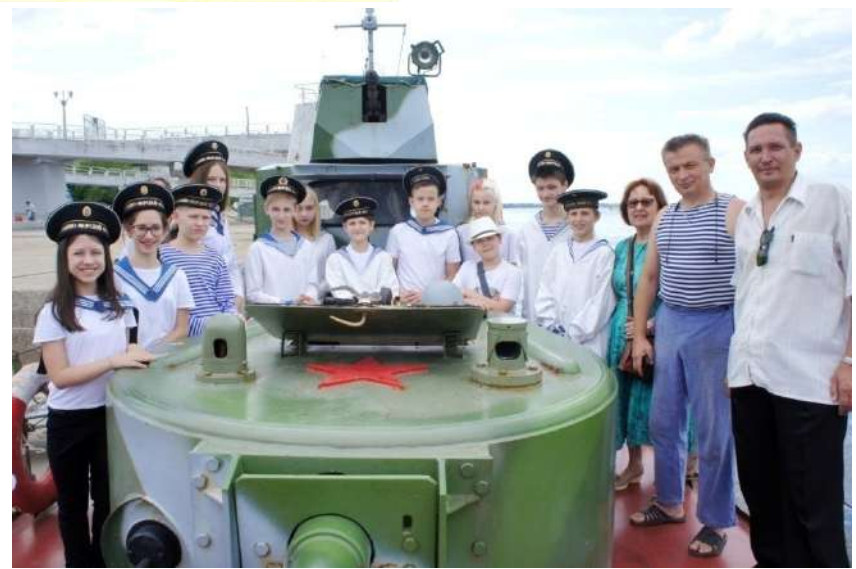
Экскурсия на бронекатере «БК-73», в рамках акции «ВЕТЕР ПОБЕДЫ-2019»