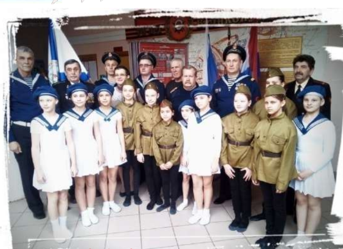
Школа № 174 поздравляет моряков