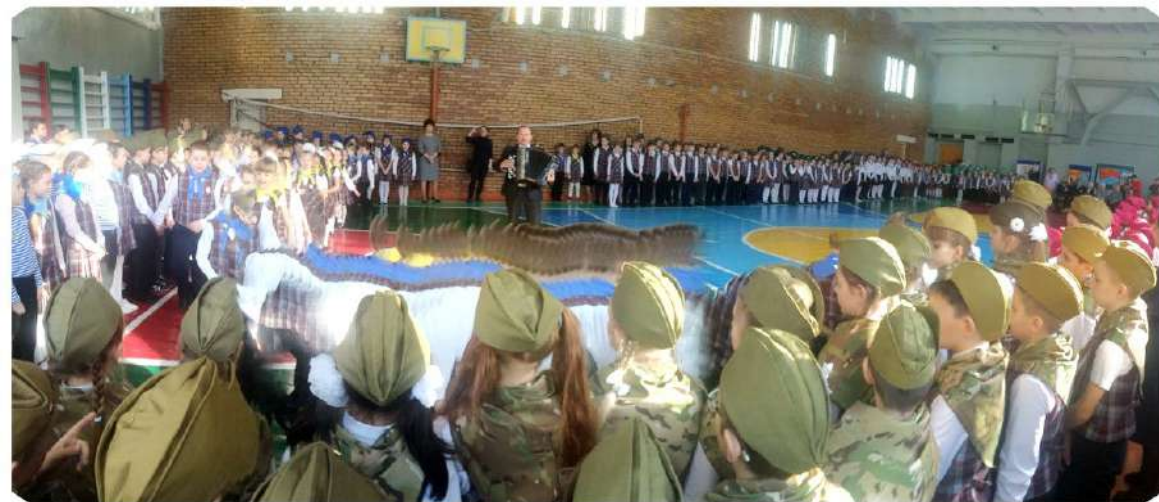
Смотр строя и песни в МБОУ Школа № 174 (21.11-2020 г.)