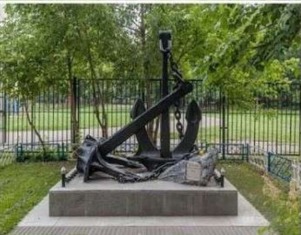
г. Москва, «Школа №1748 », Памятник юнгам (1988 г.)