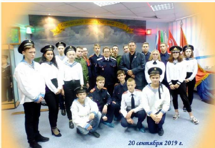
20 сентября 2019 г.