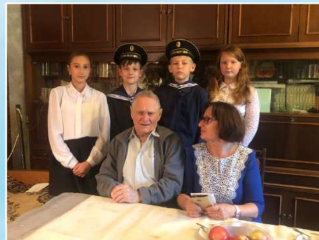
30 сентября 2019 года